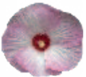
00 72 03 PINK SWIRL