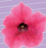
03 02 23 HOT PINK