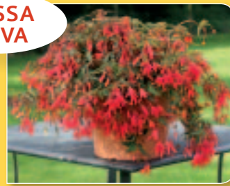
00 42 10 RED