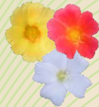
03 35 35 KOKORITA MIX