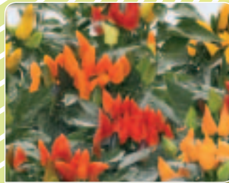
00 25 03 CALY (Favorit)