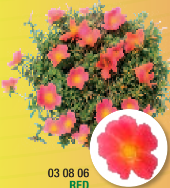
03 08 06 RED