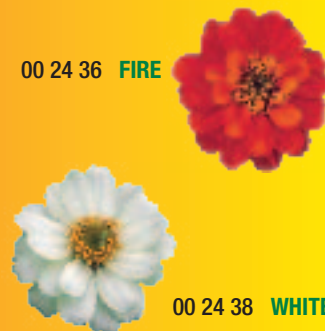
00 24 36 FIRE