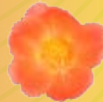
03 08 03 APRICOT