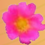
03 08 05 PURPLE