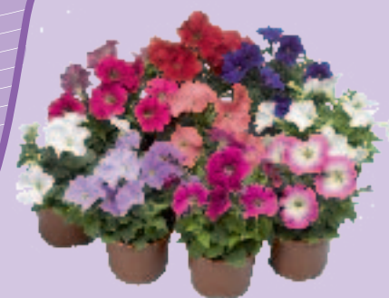
00 16 40 MIX