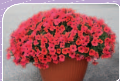
03 02 63 TABLE DARK RED