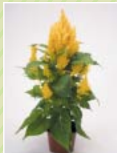
00 37 11 YELLOW