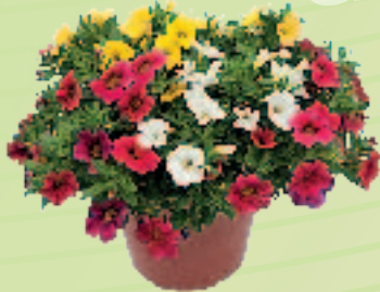
03 35 08 MIX 1