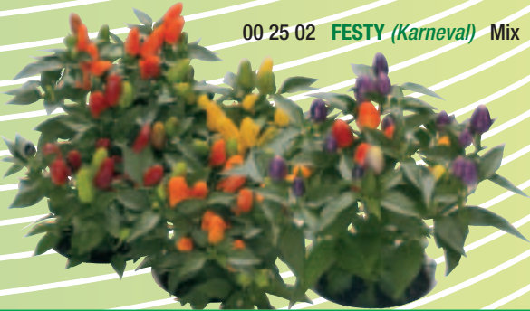
00 25 02 FESTY (Karneval) Mix