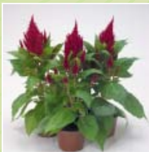
00 37 12 REDW