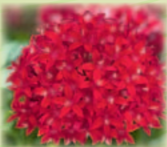
00 85 02 RED