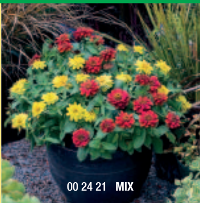
00 24 21 MIX