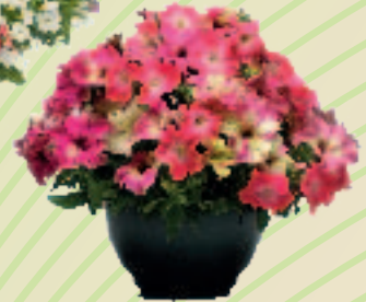
00 32 04 CANDY FLOSS