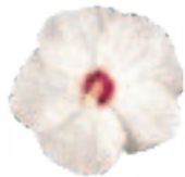
00 72 02 WHITE