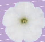
03 02 65 SNOW