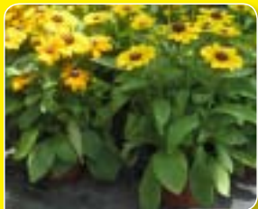
00 36 01 GOLD