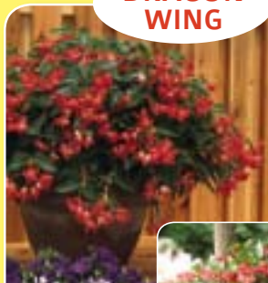
00 42 51 RED