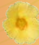
03 08 02 YELLOW