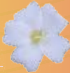
03 08 01 WHITE