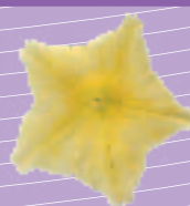
03 02 68 YELLOW