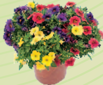
03 35 09 MIX 2