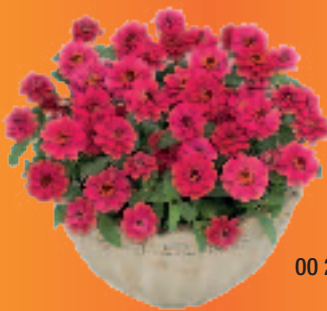
00 24 35 HOT CHERRY