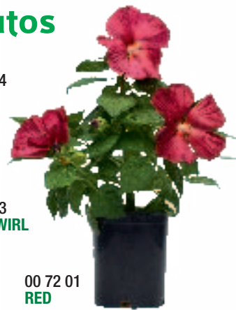
00 72 01 RED