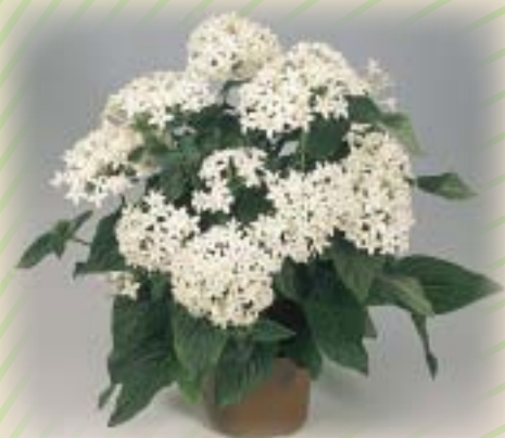
00 85 04 WHITE