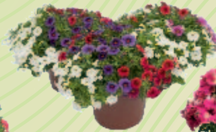
03 35 10 MIX 3