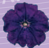
03 02 38 DARK-VIOLET