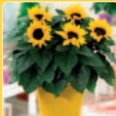
00 46 15 YELLOW BLACK CENTER