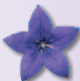
00 68 01 BLUE