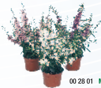
00 28 01 MIX