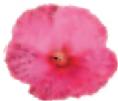
00 72 04 ROSE