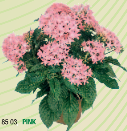
00 85 03 PINK