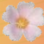
03 08 04 PINK