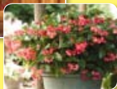
00 42 50 PINK