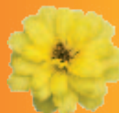
00 24 37 YELLOW