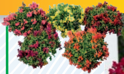
00 38 01 MIX