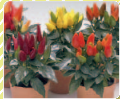
00 25 10 NACHOS (Salsa) Mix