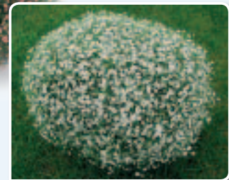
00 82 12 WHITE COMPACT