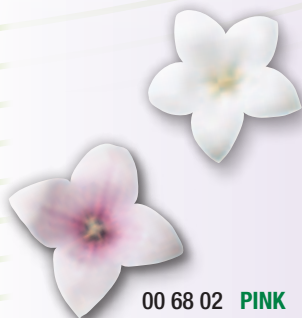
00 68 02 PINK