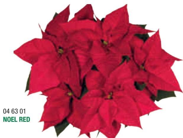
04 63 01 NOEL RED

Ramas resistentes en forma de V para plantas de gran calidad. Largo período de venta