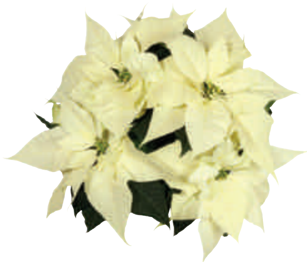
04 78 01 MERRY WHITE '14