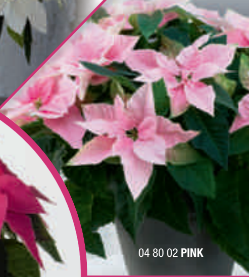
04 80 02 PINK