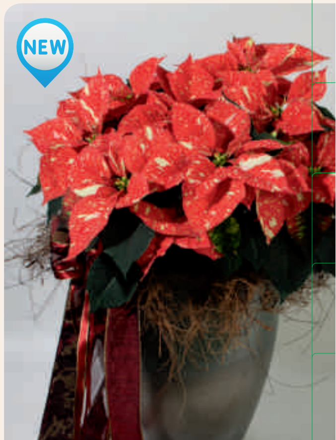
04 55 10 GLITTER '16