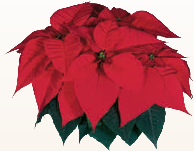
04 55 01 RED

Variedad compacta Alta productividad y larga duración posventa