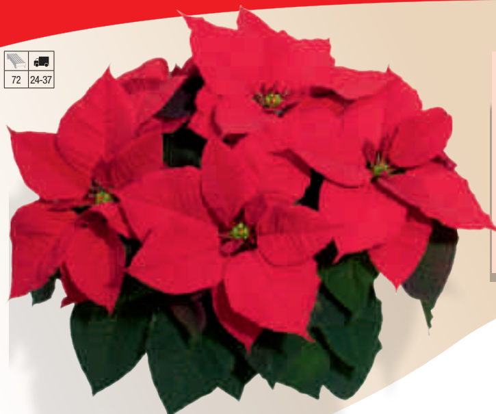
04 74 01 RED