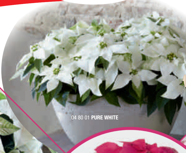
04 80 01 PURE WHITE