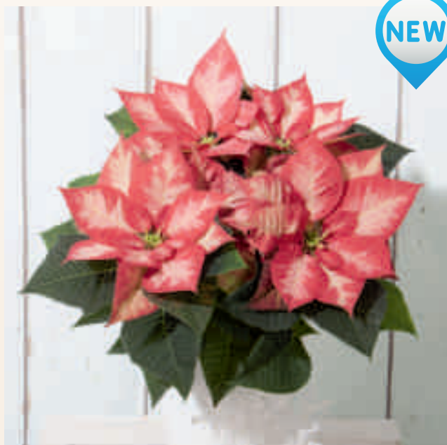
04 61 05 PRINCESS