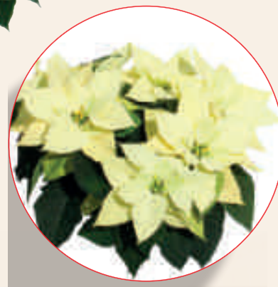
04 61 03 LIME