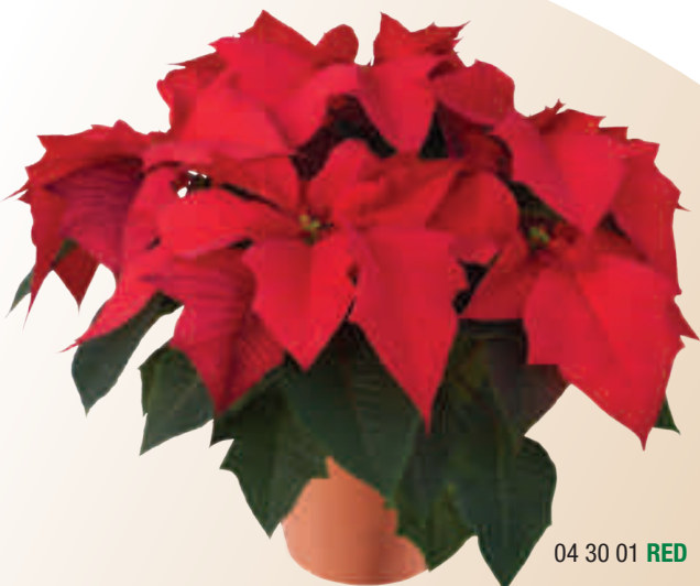
04 30 01 RED

Vigor medio con buena ramificación Flores grandes de color rojo brillante Cultivo fácil