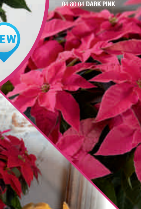
04 80 04 DARK PINK