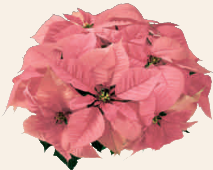
04 55 02 PINK