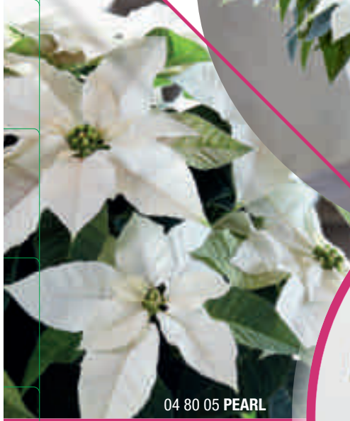
04 80 05 PEARL