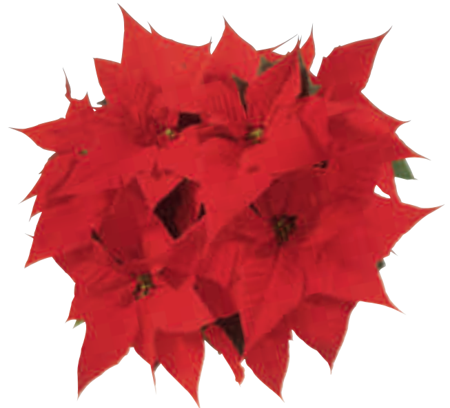
04 54 01 CHRISTMAS CAROL RED