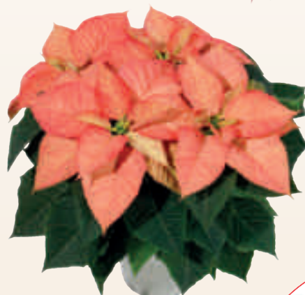
04 61 04 QUEEN