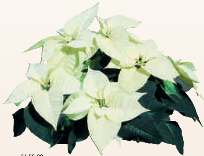
04 55 09 PEARL