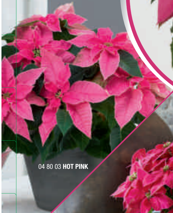
04 80 03 HOT PINK