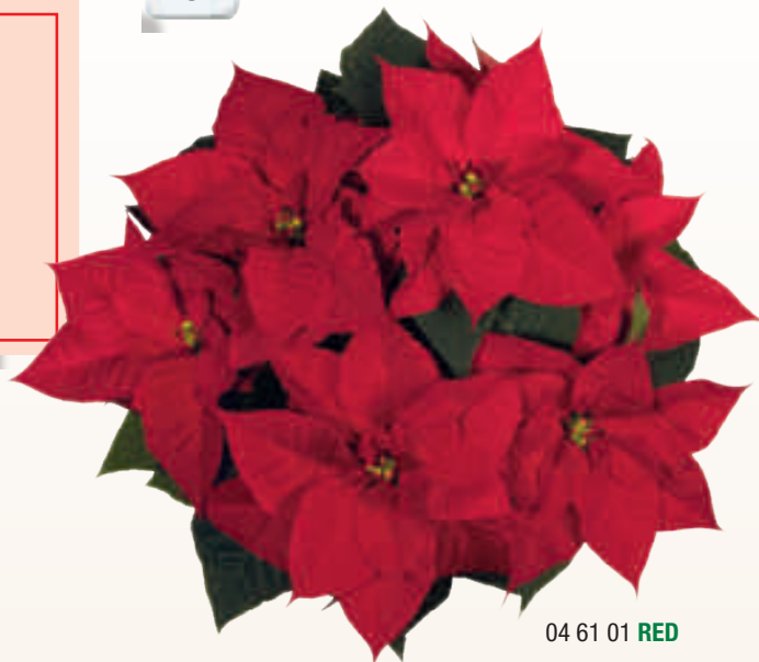
04 61 01 RED

Plantas compactas y uniformes Abundantes brácteas - Coloración precoz