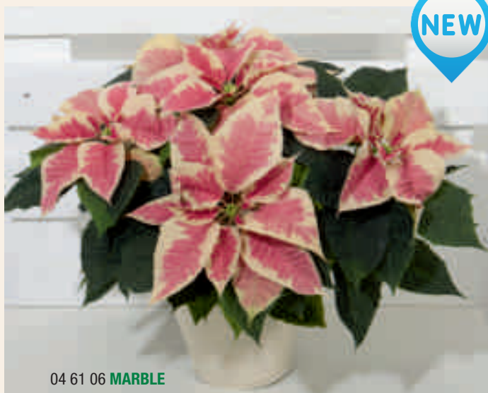
04 61 06 MARBLE