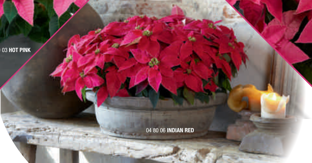
04 80 06 INDIAN RED