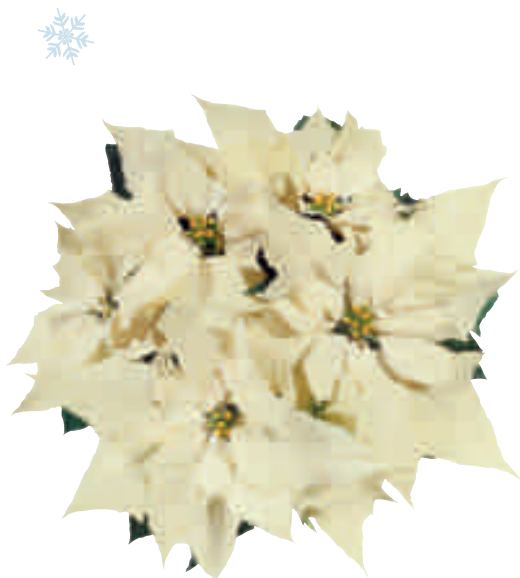
04 66 01 WINTERSUN WHITE

Planta de vigor medio Porte erguido y robusto Coloración precoz y flores de larga duración